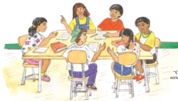
Ilustración del libro "Carlos y sus Amigos" de la serie de cuentos multiculturales publicada por INCRE

INCRE desarrolló e implementó un sistema de evaluación escolar del aprendizaje para los 26.000 maestros de educación preescolar y básica. Las actividades incluyeron desarrollo de actividades de evaluación, definición de normas de evaluación consistentes con los objetivos nacionales de enseñanza, así como una extensiva capacitación docente. Todas estas actividades se diseñaron para promover en los docentes una práctica de evaluación permanente del aprendizaje de los alumnos.