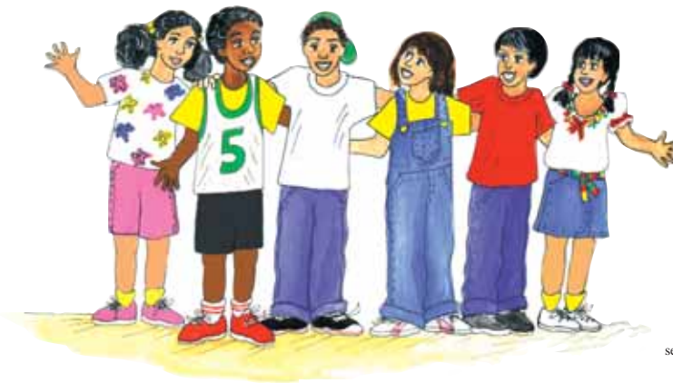
Ilustración del libro "Carlos y sus Amigos" de la serie de cuentos multiculturales publicada por INCRE

INCRE, a petición del Departamento de Educación del Estado de Massachusetts, condujo un estudio para investigar el estado y las tendencias de los 53 programas de educación bilingüe en Massachusetts.